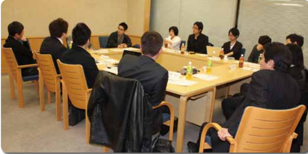
全員揃ったところで白熱する座談会

3回と中身の濃いものにしていただきたいと思います。広報委員会にお願いですが、次回をもっと明確に議題、流れを決めて会議を始める必要があるでしょうね。それではお疲れ様でした。