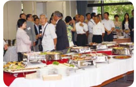
盛りあがる懇親会

腿の部位を一塊、ローストビーフにして持ち込み、出席者に振舞われました。味はさすが最上級の5等級飛騨牛だけに、みんなを感激させるものでした。会場でキビキビと動き回るハッピ姿の従業員に混じりサーブしてくれた主人とおかみに感謝感激。なんでも「秋の総会でもサーブしますよ」とか・・・楽しみですね。