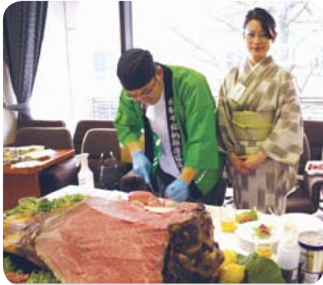
60kgもある飛騨牛のモモ肉

腿の部位を一塊、ローストビーフにして持ち込み、出席者に振舞われました。味はさすが最上級の5等級飛騨牛だけに、みんなを感激させるものでした。会場でキビキビと動き回るハッピ姿の従業員に混じりサーブしてくれた主人とおかみに感謝感激。なんでも「秋の総会でもサーブしますよ」とか・・・楽しみですね。