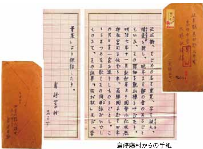
島崎藤村からの手紙