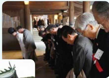
皆んなで昇殿参拝